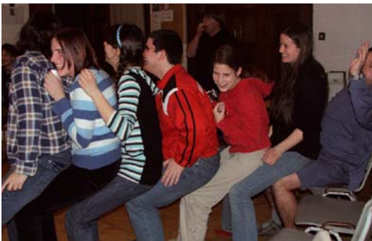
Játék a javából